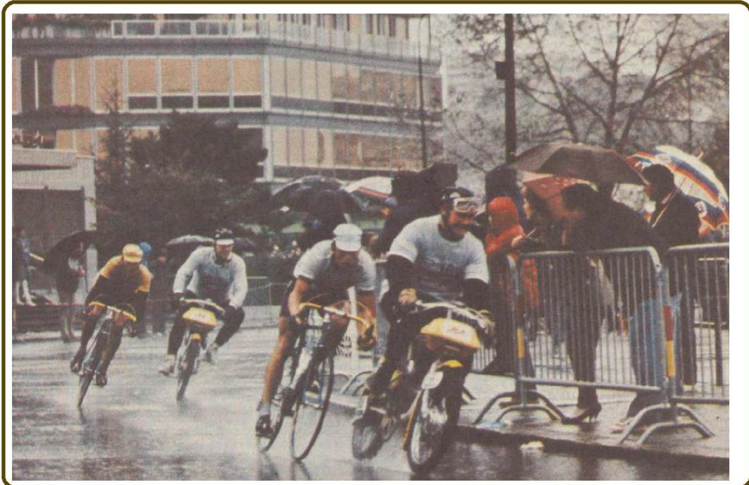
Sous la pluie et dans le froid, Greg Lemond emmène le vainqueur du Tour de France Fignon dans la chasse à Kelly qui s'est échappé.

A 20 de meta Kelly tiene 20 segunditos; no son suficientes.