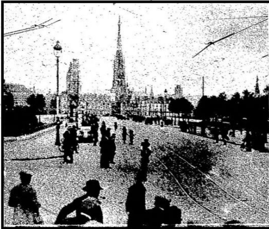
Les Rémois passent, sans s'attarder inutilement, à Rouen, dans l'ombre de la cathédrale célèbre.

A las 12h 59min llegan Frantz, Bidot, Leducq y Depauw.