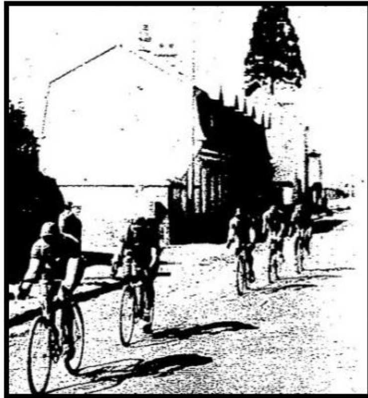
Les Clochetons, qui enlèveront la course, après Evreux.

De modo que tenemos a Alleluia en punta con 2 minutos sobre los lobitos y 11 sobre Alcyon.