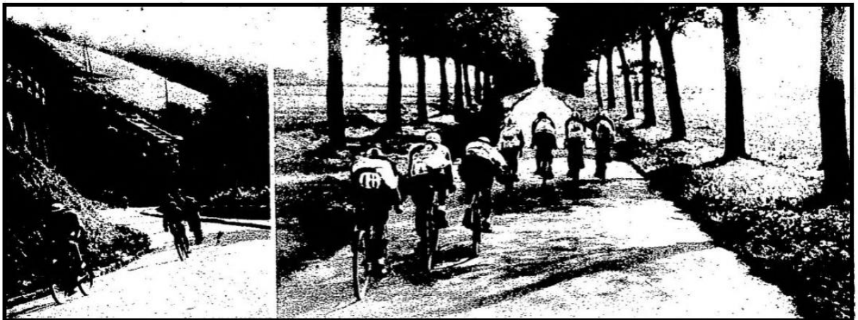
GRAND PRIX WOLBER. — 1 : Le team des Perroquets en pleine action. près de la chapelle de Bonsecours. à Rouen. —

Los lobitos salen a las 7 y media; Reims a las 8 menos cuarto; Alcyon a las 8 y los de la campanita a las 8 y cuarto.