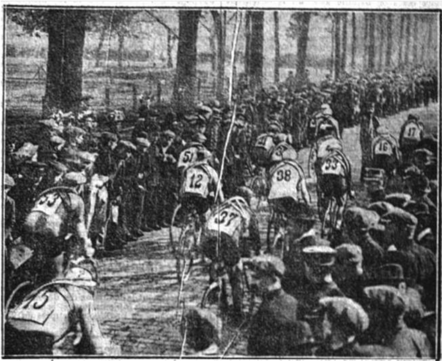
Le départ d'Anvers, à la Porte de Breda

Los ciclistas parten hacia el este, el Limburgo y la frontera holandesa; una vez allí giran hacia el sur; una vez en Lanaken se vuelve a girar, esta vez hacia poniente, es decir, hacia Bruselas; de ese modo transformamos 50kms en más de 250.