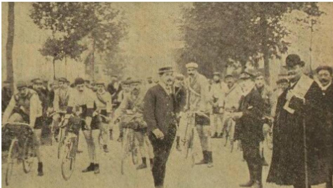
Le départ de Reims donné hier à 5 heures du matin.