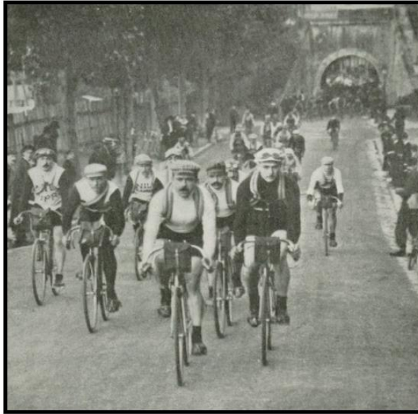
Au départ. Le Tour de France de 1909 a battu le record des engagés et des portants. 155 concurrents se sont présentés au départ, place de la Concorde.