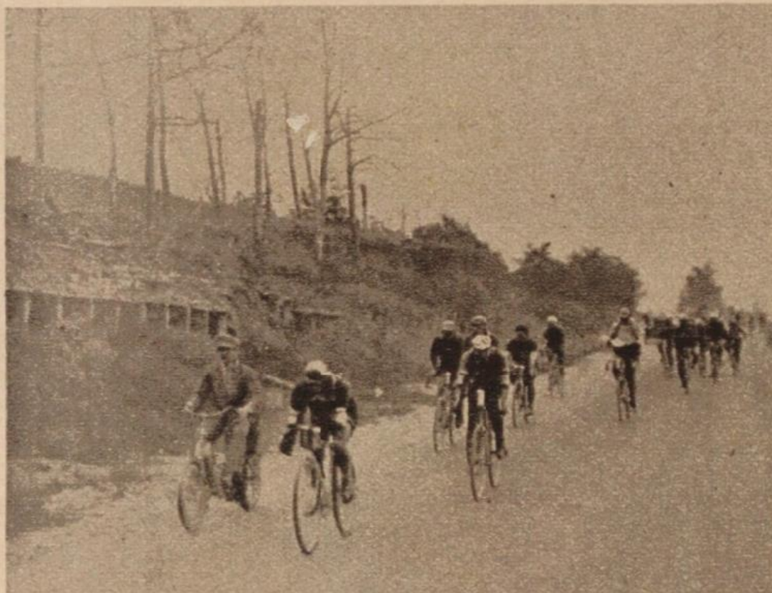
GIRARDENGO PRÉCÈDE ALAVOINE A LA NEUVILLETTE

En la Montaña de Reims Suter parece en dificultad, pero se reintegra fácil.