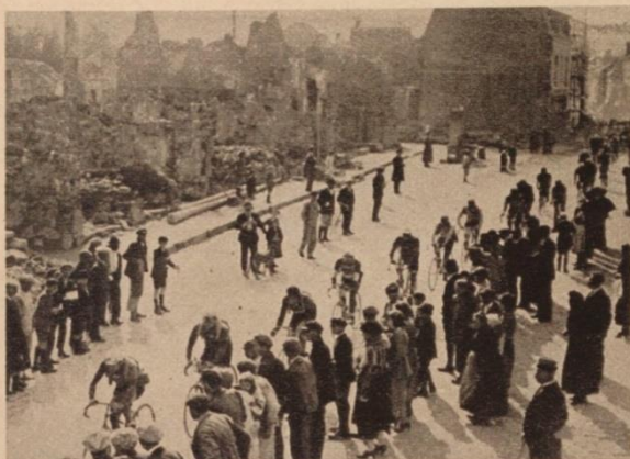
LA FILE DES COUREURS DANS LES RUINES DE DORMANS