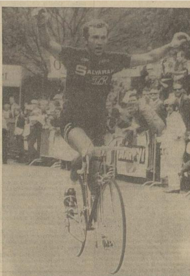
Gianni Motta que l'on voit ici terminer en vainqueur la première partie de la dernière étape à Lugano, a bien mérité sa victoire dans le Tour de Romandie et souhaitons que ce garçon à la classe pure, étonnante, ait enfin retrouvé à nouveau tous ses moyens.